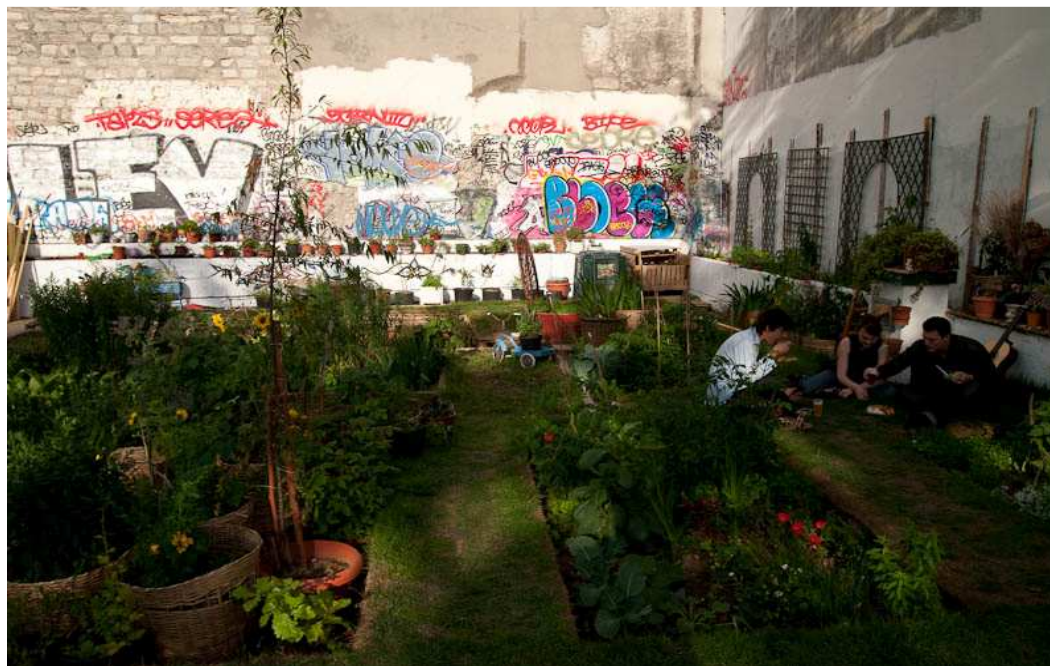
Illustration 3: Jardin. Bal des "pas perdus". Par Christopher ROUSSEAU.

Lors du Festival Intersquat Européen qui s'est déroulé à Rome en octobre 2009, l'organisation mise en place par les squatteurs souligne ces aspects. Des repas végétariens étaient proposés, des poubelles permettant de réaliser un tri sélectif des déchets ont été mises en place... Enfin, des débats ont été organisés chaque jour permettant aux différents squats européens de mutualiser leurs expériences, leur vécu, leurs projets.