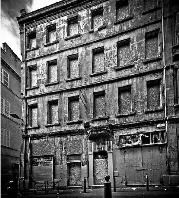
Illustration 1: Façade d'un bâtiment muré à Marseille.

Selon le Dictionnaire de l'Habitat et du Logement 10 , « Un logement est vacant lorsqu'il n'est utilisé, tout ou partie de l'année, ni comme résidence principale, ni comme résidence secondaire pour des séjours temporaires ».