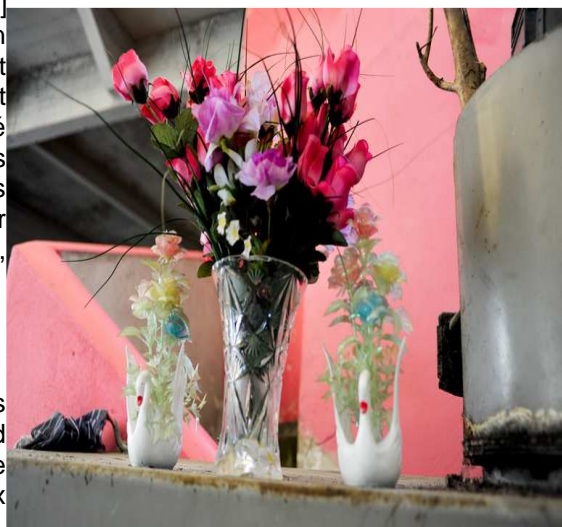
Illustration 2: Détails d'un squat. Par Thomas AUBIN

Dans la plupart des squats qui m'ont ouvert leurs portes, il apparaît que la répartition des espaces dépend en grande majorité de l'agencement des pièces dans le bâtiment occupé. Cependant, selon les lieux, des choix différents sont effectués par les habitants.