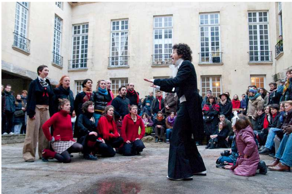
Illustration 7: Représentation de la compagnie Jolie Môme à La Marquise. Squat du Collectif Jeudi Noir, Place des Vosges. Par Christopher ROUSSEAU.

Il est impératif d'aller vers les voisins, dès que votre présence est découverte. L'information « qu'il y a des squatteurs » va faire le tour du quartier dans l'heure, et il est important de couper court immédiatement à la psychose. Ne pas hésiter à aller discuter avec eux, se présenter, insister sur votre situation difficile, sur le scandale que représentent les bâtiments vides... Les voisins, surtout dans les quartiers un peu chics, ne voient pas d'un bon œil l'arrivée de jeunes en difficulté financière. Ils n'ont pas pitié de vous, donc habillez-vous bien pour aller les voir, et jouez plutôt sur l'identification : vous êtes des travailleurs comme eux, vous vivez honnêtement, mais les loyers sont devenus fous, et la seule solution est de réquisitionner » 46 .