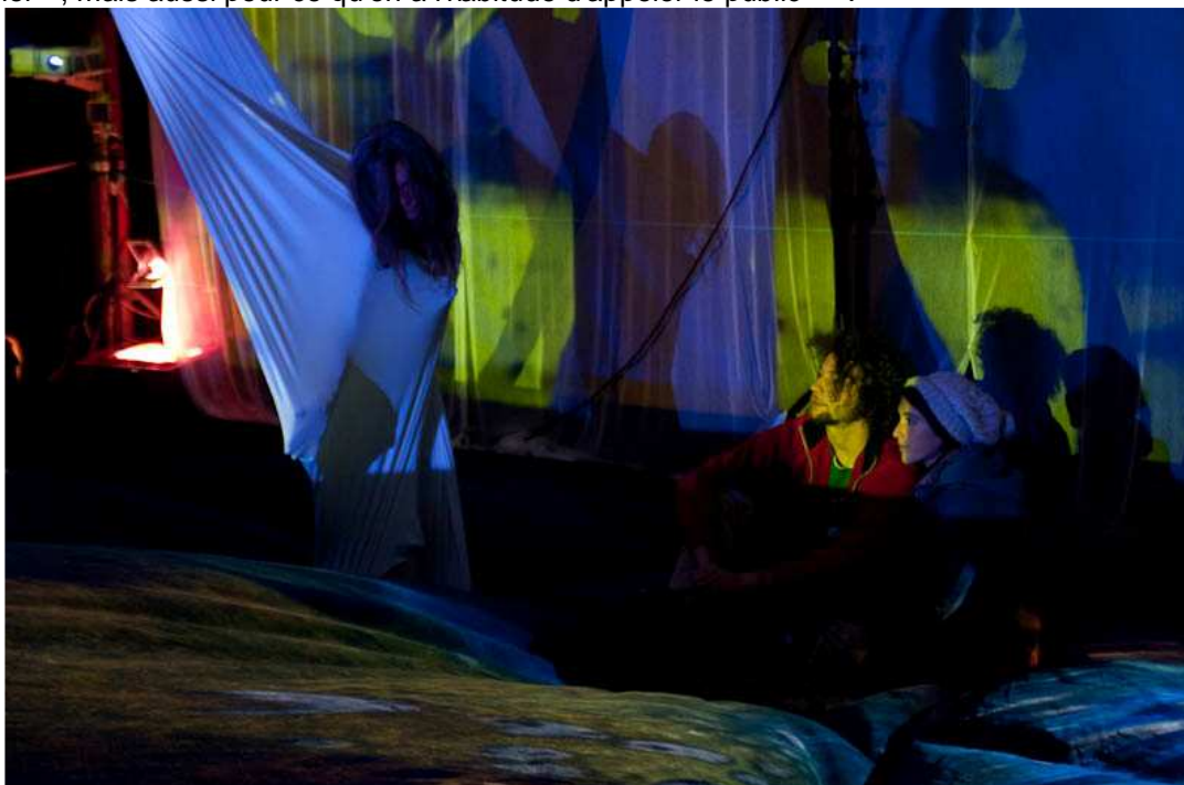
Illustration 5: Performance artistique. Festival Intersquat Européen. Octobre 2009. Par Christopher ROUSSEAU.

faire, ils interviennent comme des opérateurs d'ouverture de la culture sur la ville. [...] L'occupation relève d'une volonté d'ouverture de lieux qui seraient plus accessibles, non seulement pour les « créateurs » en quête d'espace pour « travailler », mais aussi pour ce qu'on a l'habitude d'appeler le public » 45 .