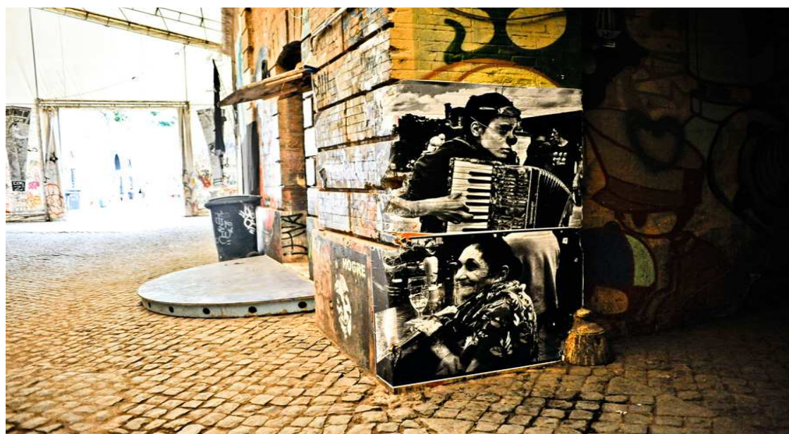
Illustration 4: Collages. Festival Intersquat Européen. Octobre 2009. Par Thomas AUBIN

Yann, squatteur, évoque la « relative liberté créatrice et la possibilité de voir et d'entendre des formes et des expérimentations artistiques singulières » au sein des squats.